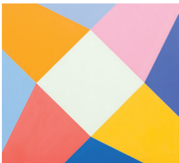
Verena Loewensberg, sans titre, 1966, huile sur toile 101×101 cm, Musée des beaux-arts de Lucerne, dépôt de la Fondation BEST Art Collection Lucerne, anciennement Fondation Bernhard Eglin

Qu'est-ce qui est beau? Un paysage idyllique, un corps parfait, un visage d'enfant aux joues rouges ou un son de couleur abstrait? Le bon art est-il beau? La beauté objective existe-t-elle vraiment? Ou est-ce une question de goût?