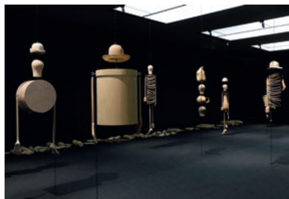
Wiebke Siem, Der Traum der Dinge, 2016/2022, vue de l'exposition au Musée d'art moderne, Salzbourg

L'artiste allemande Wiebke Siem (*1954) fait entrer avec fracas le fantastique grotesque dans le quotidien domestique. Que ce soient des déguisements, qui invitent à se glisser dans un autre sexe, ou des meubles avec des bras qui pendillent, Wiebke Siem crée un univers tant comique qu'abyssal, qui démasque, avec ironie et finesse, les contradictions et imperfections de notre cadre de vie. Dans ses œuvres, l'artiste allie un regard féministe à la critique des stratégies problématiques d'appropriation de l'art extra-européen dans le modernisme. Les sculptures ouvrent la voie à de nombreuses associations avec l'histoire de l'art, qu'il s'agisse des figures de Sophie Taeuber-Arp, de l'atelier de théâtre du Bauhaus, de caricatures ou de collages surréalistes.